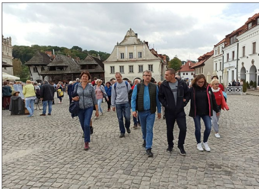
Rynek - serce Kazimierza Dolnego

Po południu jedziemy do Gołębia, którego największą atrakcją jest kościół św. Floriana i św. Katarzyny z początku XVII wieku, będący też Sanktuarium Matki Bożej Loretańskiej Patronki Ludzi w Drozdzie. Historię parafii, kościoła oraz domu loretańskiego stojącego obok świątyni przybliżył nam proboszcz miejscowej parafii. Kolejna atrakcja czeka nas w Janowcu, gdzie na wiślanej skarpie stoją ruiny potężnego XVI-wiecznego zamku. Choć