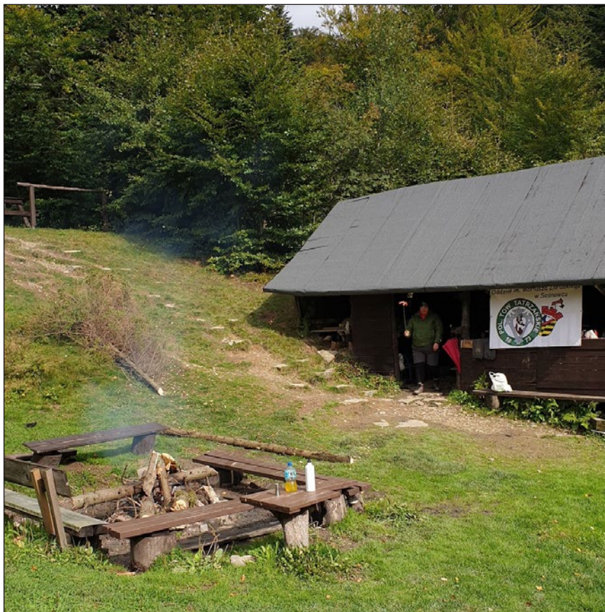
Na polanie Wały

Popołudnie udało się spędzić przy ognisku i rozmowach na tematy bardzo różne i nurtujące mniej lub bardziej poszczególnych uczestników. Część popołudnia, dzięki współczesnej technice łączności i dobremu zasięgowi sieci telefonicznej, wypełniło nam kibicowanie zmaganiom polskich siatkarzy w Mistrzostwach Europy. Po meczu, pod wiatą zagościły gitary i nasze ulubione piosenki.