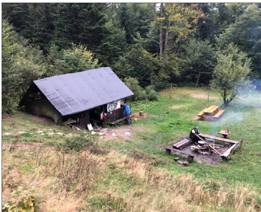
Na polanie Wały

Noc z soboty na niedzielę przyniosła obfite opady deszczu, który skutecznie utrudniał sen.