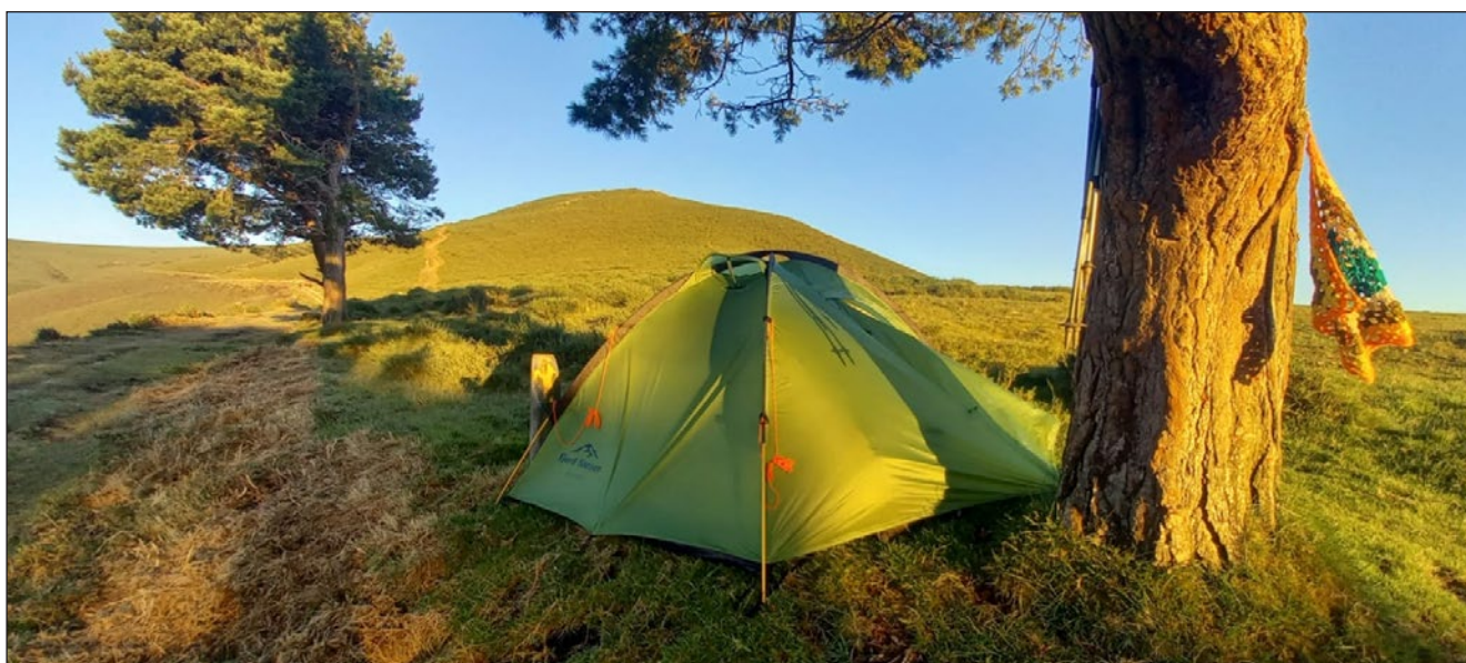
Poranek na Ruta de los Hospitales