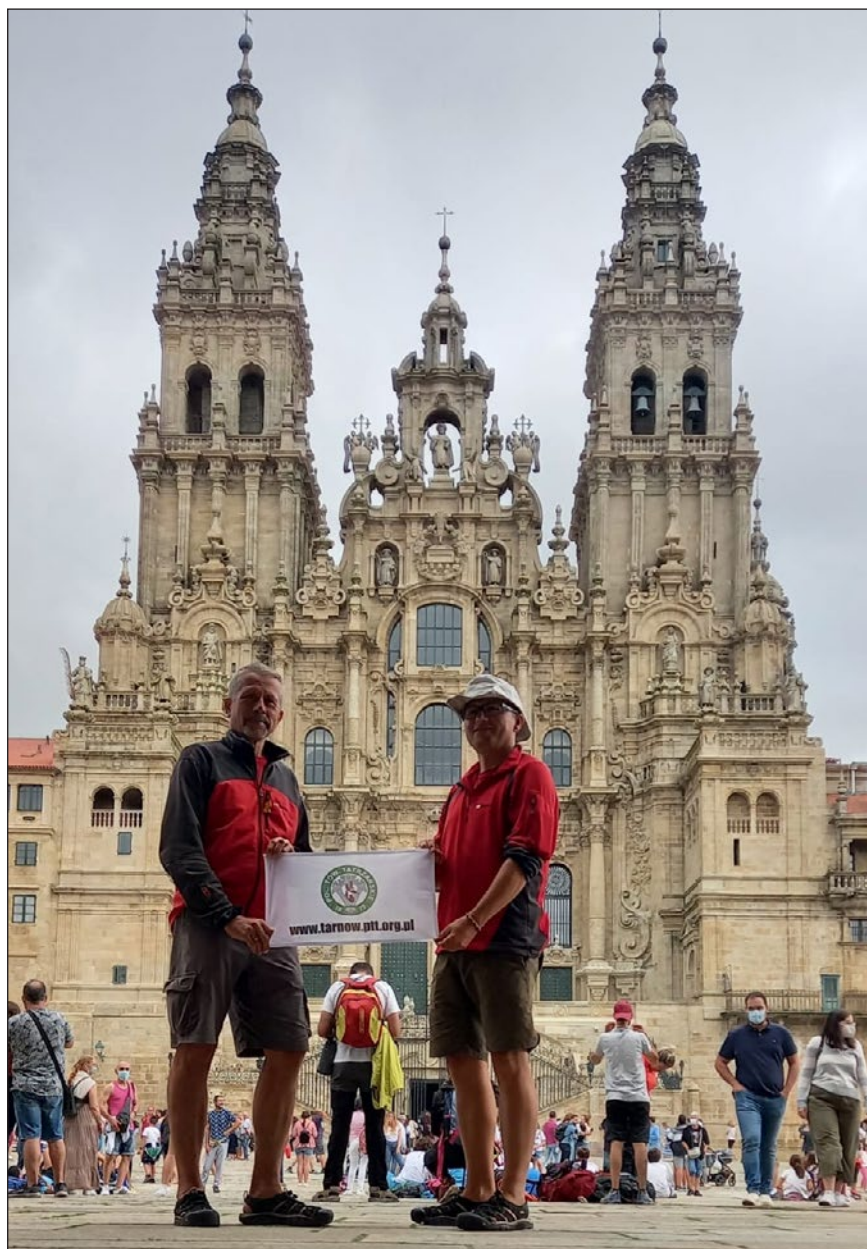
Przed katedrą w Santiago

Nasze dni były bliźniaczo podobne do siebie. Pobudka ok. 7:30 (słońce w Hiszpanii wschodzi w lipcu przed siódmą rano), zwijanie biwaku i wymarsz. Po drodze śniadanie i lunch. Kilka przerw w wędrowce i w okolicy godziny 21 lub nieco później organizowanie noclegu. Niespełna 170 km przed Santiago na przełęcz Acebo (1031 m n.p.m.) opuszczamy Asturię i wkraczamy do Galicji. Czujemy się prawie jak u siebie, wszak obydwoj od urodzenia jesteśmy mieszkańcami krainy o tej samej (historycznie) nazwie. Cóż z tego, że obydwoje Galicję dzieli prawie 4000 km. Galicja to Galicja.