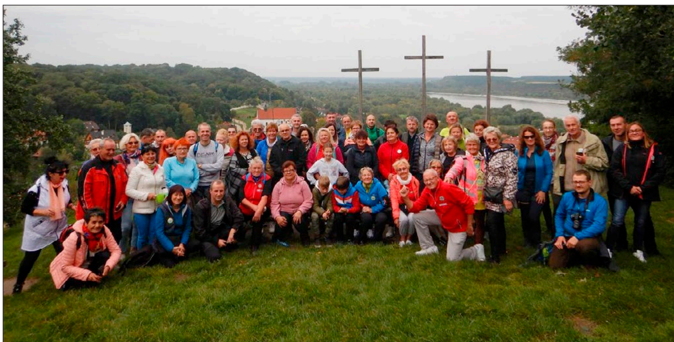
Na Górze Trzech Krzyży