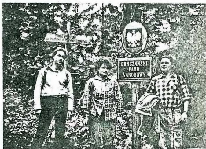
W Gorcach, 23.09.1990