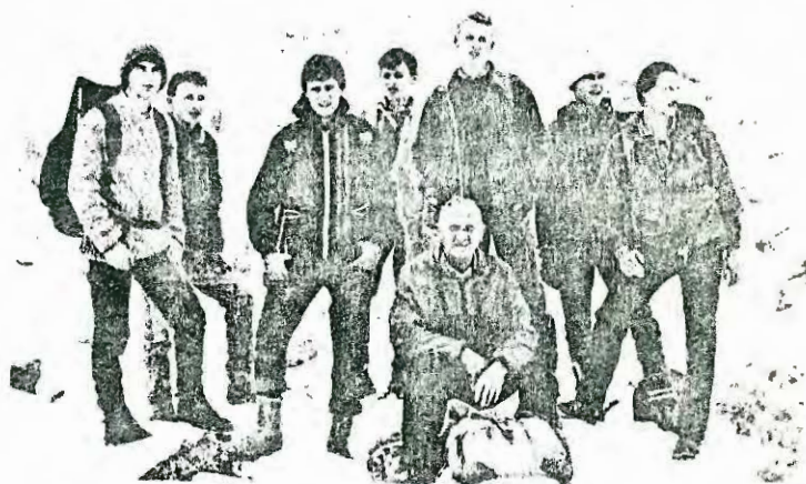
W Dolinie Pańszczy, 16.09.1990

Nawiązując do 84-letniej tradycji Oddziału PTT w Nowym Sączu oraz w oparciu o Statut (par. 2 stwierdzający, że PTT jest kontynuatorem tradycji Towarzystwa Tatrzańskiego powołanego w 1873 r. i przemianowanego w 1920r. na Polskie Towarzystwo Tatrzańskie istniejące do 1950r. oraz par. 6 stwierdzający, że PTT używa tradycyjnych odznak i pieczęci), Oddział PTT w Nowym Sączu przyjmuje nazwę "Beskid" której używał w latach 1906 - 1950.